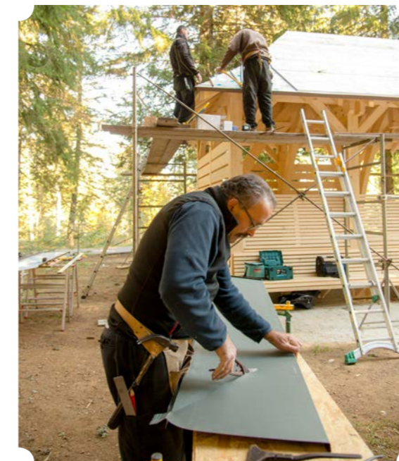
↑ Construction du Habert de la prairie du Col de Porte ; ONF Forêt d'Exception

(1) Le 15 mars 2019, le Jura est devenu le 2 e territoire à obtenir une AOC Bois.