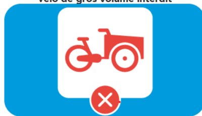
Vélo de gros volume interdit

L'embarquement de tricycles, fatbike, triporteurs, tandems et cargos... est interdit à bord.