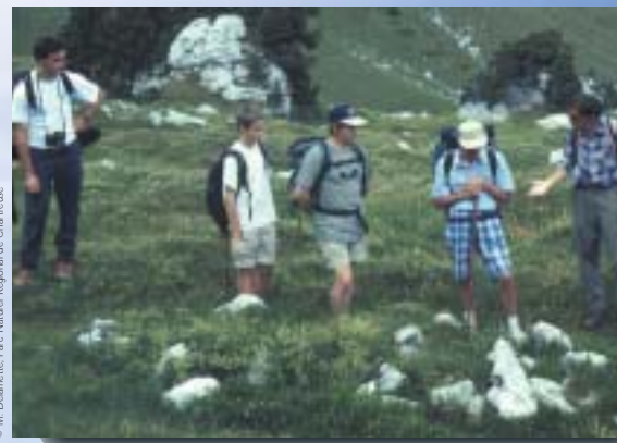
"Tombe de Berger" ? sur l'Aulp du Seuil