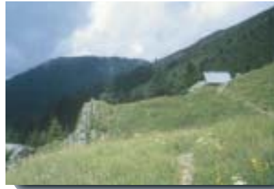
Cabane de Bellefont