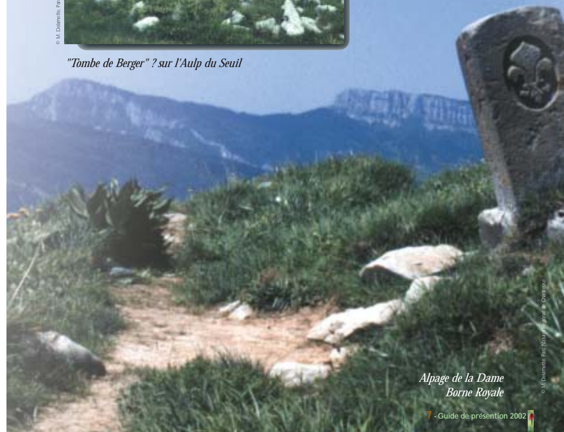
Alpage de la Dame Borne Royale