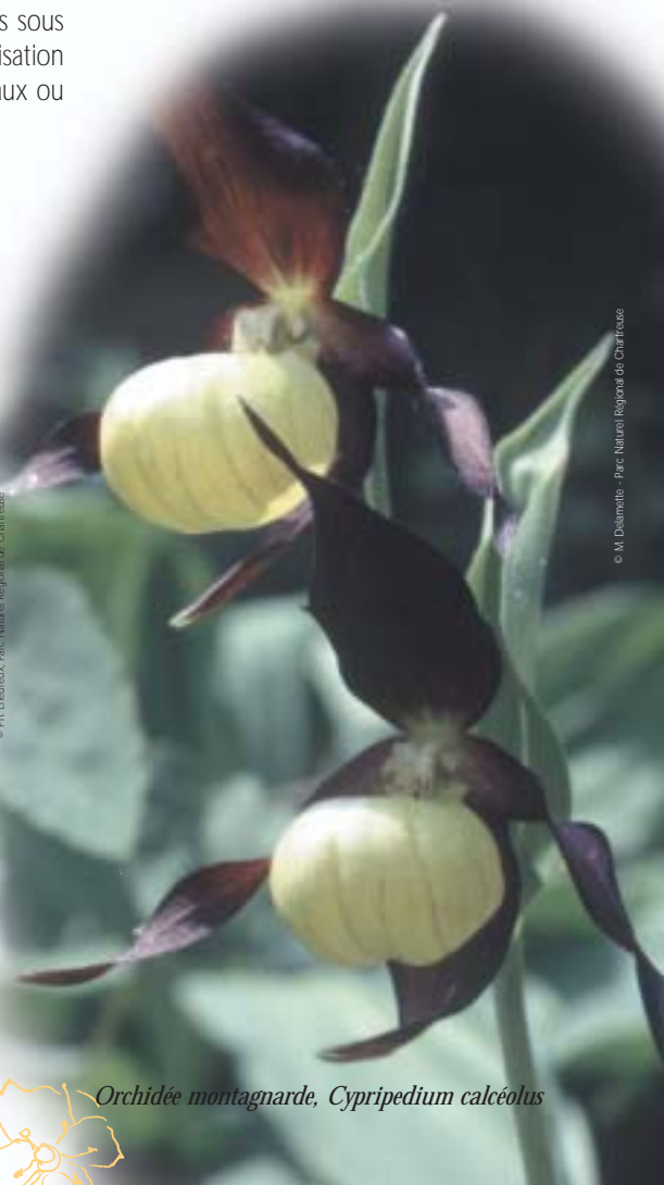
Orchidée montagnarde, Cypripedium calceolus