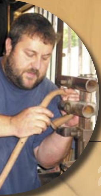
Les Cannes Boursier (marque Parc)